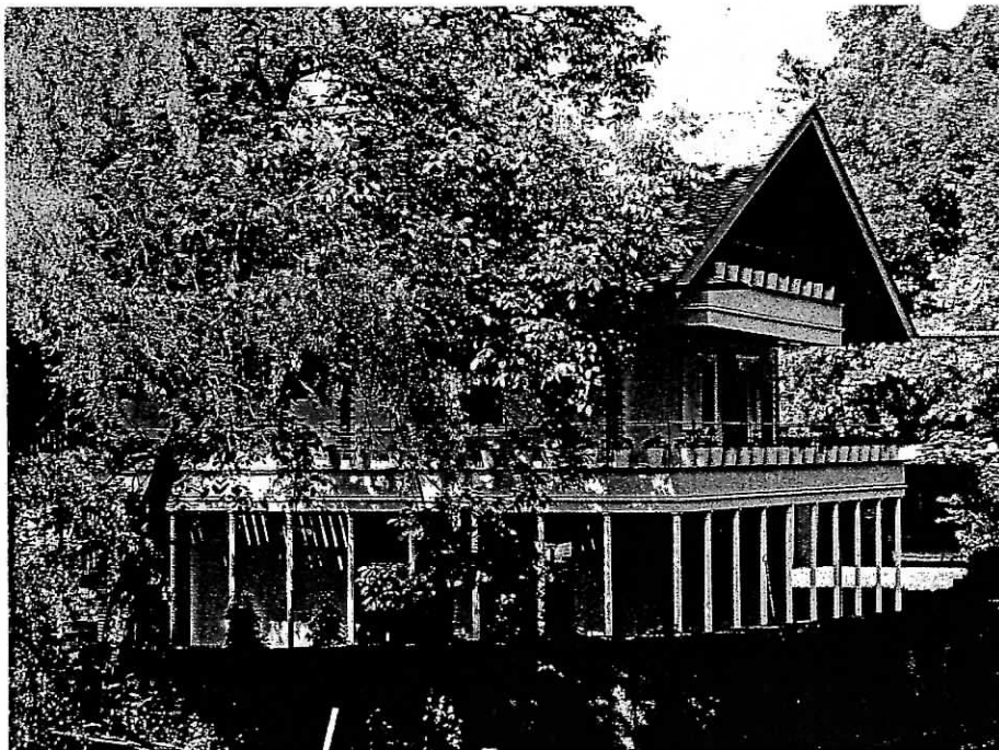
Der Gingko-Baum vor dem Haus.

Der von der Lotterie-Treuhandgesellschaft mbH gestiftete Hessische Denkmalschutzpreis ist mit insgesamt 15.000 Euro dotiert und ging in 2002 an Vereine, Privatpersonen und kommunale Initiativen, auf die das Preisgeld aufgeteilt wurde. Das Petrihaus erhielt eine Urkunde mit Anerkennung.